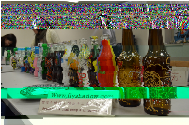
同學們展示二小時的精心製作的作品