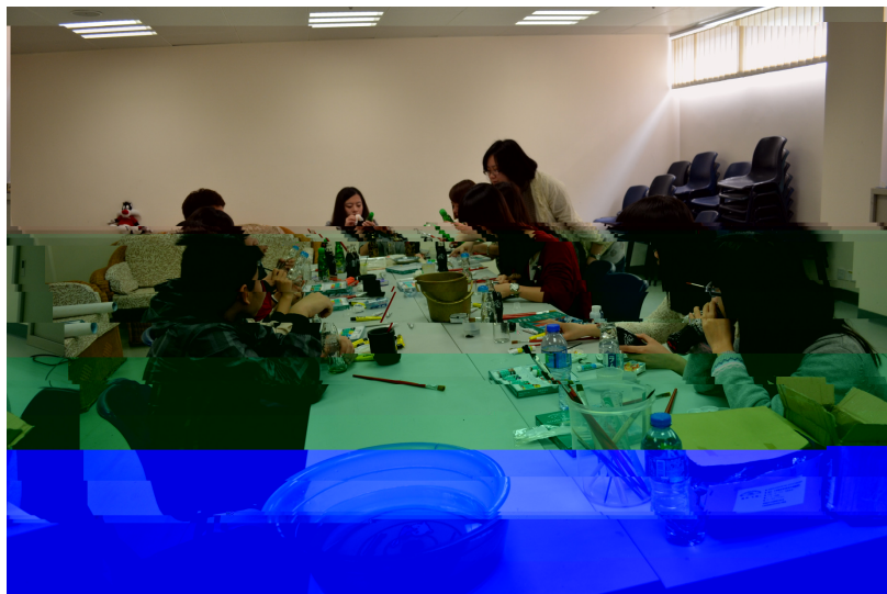
老師正在講解如何手繪玻璃

活動結束後，採訪了幾位同學，他們都表示非常喜歡這個活動，一位同學表示這個活動非常好，如果明年還有活動一定再次參加，另一位同學表示，平時都在忙學習，很少自己去做一些手工製品。這個活動讓她把自己的創意變成一個非常漂亮的工藝品。